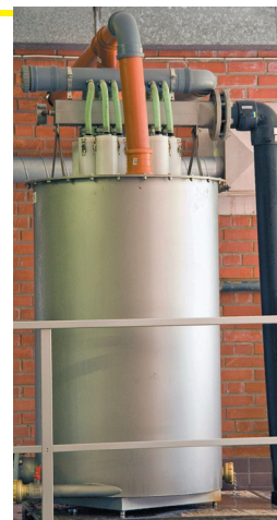
EFEKTYWNY™ installerad på Skurupsvatten

EFEKTYWNY™ är utrustad med rör som vart och ett kan behandla 5,5 m 3 /h. Aeratortanken kan utrustas med 3 till 24 rör vilket ger en effekt av 16,5 - 132 m 3 /h.